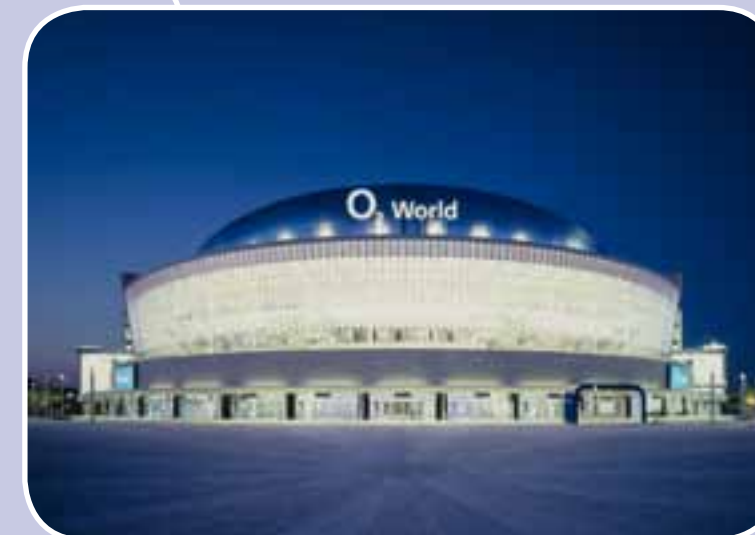
Sport- und Kulturarena O 2 World, Berlin

Brandschutz sollte deshalb nicht als lästige, vom Gesetzgeber auferlegte Pflicht verstanden werden, sondern als sinnvolle und verantwortungsbewusste Investition in die Zukunft Ihres Unternehmens mit dem damit verbundenen Schutz von Menschenleben und Sachwerten.