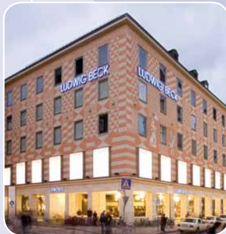
Warenhaus Ludwig Beck, München

Im schlimmsten Fall führt ein Brand nicht nur zu einem finanziellen Verlust, sondern zu unwiderbringlichen Kundenverlusten, zum Verlust von Marktanteilen und / oder Arbeitsplätzen. Keine Versicherung der Welt haftet über den Sachschaden hinaus für Ihre so entstandenen Verluste – schon gar nicht für den ideellen Schaden oder gar den lebenslangen Verlust Ihrer Existenz.